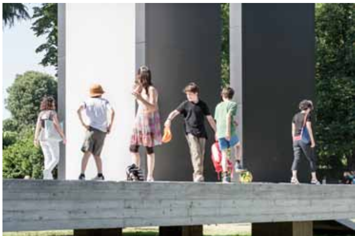
Teatro Continuo di Burri, Parco Sempione, Milano, 2015, serie di fotografie a colori, fine art ink jet print su carta baritata, 100 x 150 cm