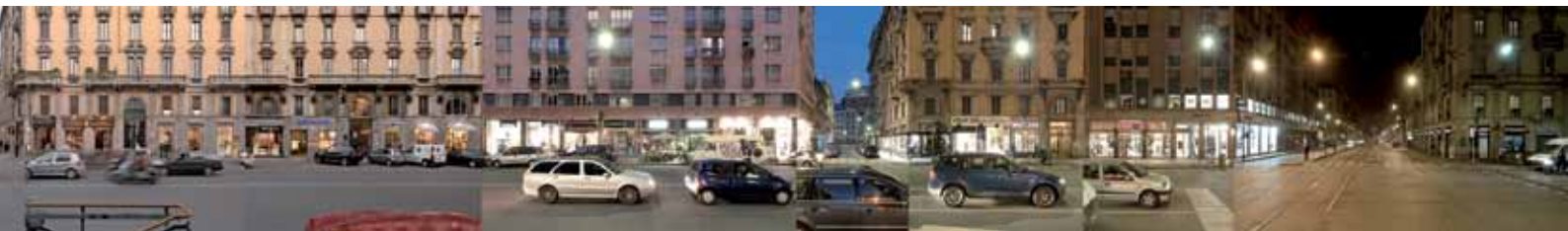
Strip Milano corso Buenos Aires night and day, Milano, 2015, 40 x 280 cm