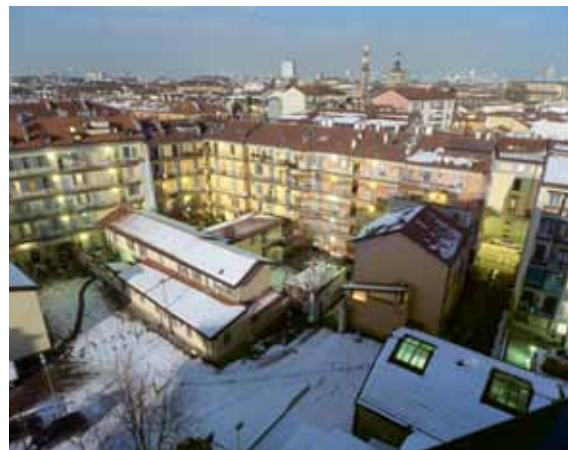
Rear Window, Milano casa Fernanda, 2012, fotografia, 40 x 55 cm