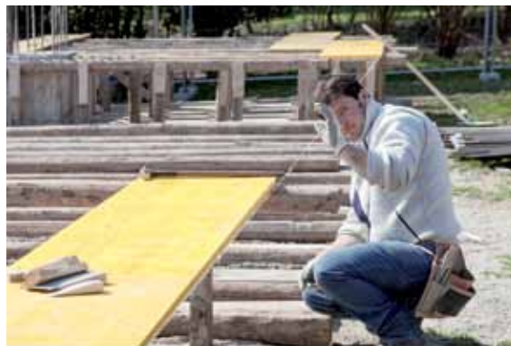
Teatro Continuo di Burri, Parco Sempione, Milano, 2015, serie di fotografie a colori, fine art ink jet print su carta baritata, 30 x 40 cm