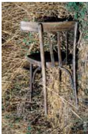
Concrete Island , 1996-2001, fotografia, 120 x 80 cm