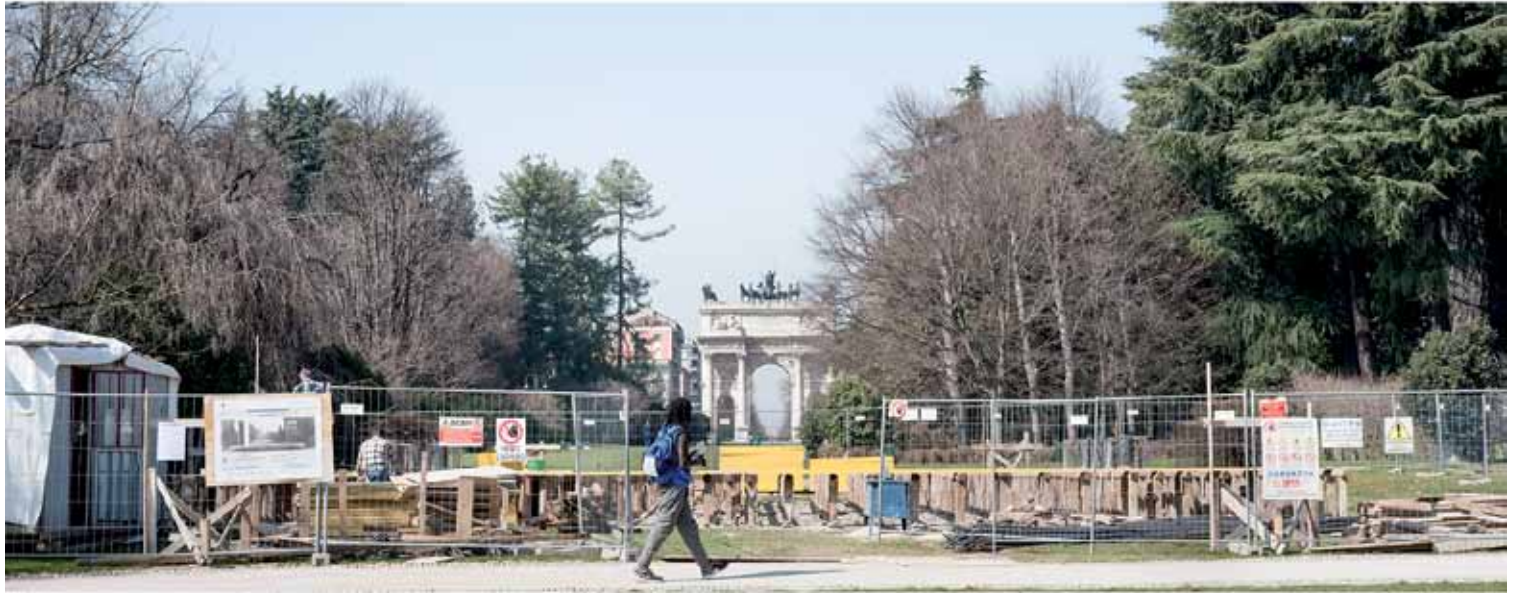
Teatro Continuo di Burri, Parco Sempione, Milano, 2015, serie di fotografie a colori, fine art ink jet print su carta baritata, 30 x 40 cm