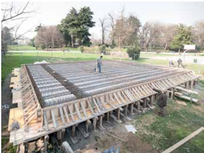
Teatro Continuo di Burri, Parco Sempione, Milano, 2015, serie di fotografie a colori, fine art ink jet print su carta baritata, 105 x 107 cm