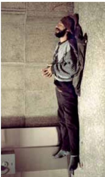
Rischiamo pene molto severe , 1998-2001, fotografia, 210 x 125 cm