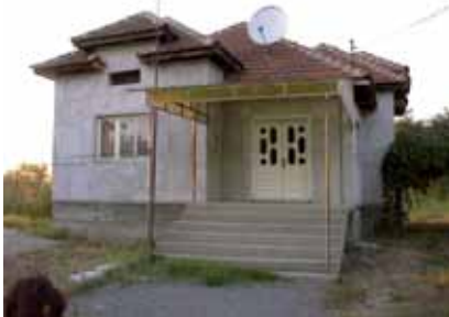
Video Rom, Milano Romania, 1998, video, 12 minuti