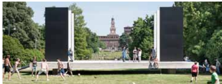
Teatro Continuo di Burri, Parco Sempione, Milano, 2015, serie di fotografie a colori, fine art ink jet print su carta baritata, 100 x 250 cm