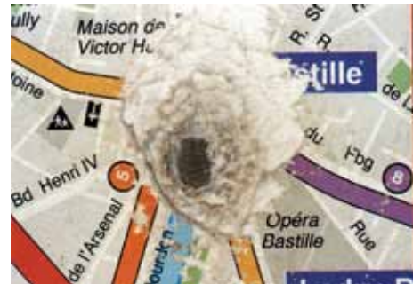
La disparition , 1994/95, collage di 350 fotografie, 400 x 450 cm