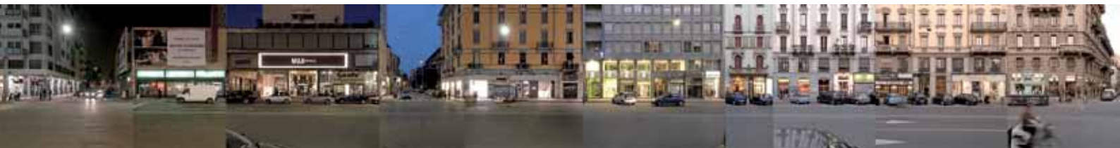
Strip Milano corso Buenos Aires night and day, Milano, 2015, 40 x 299 cm