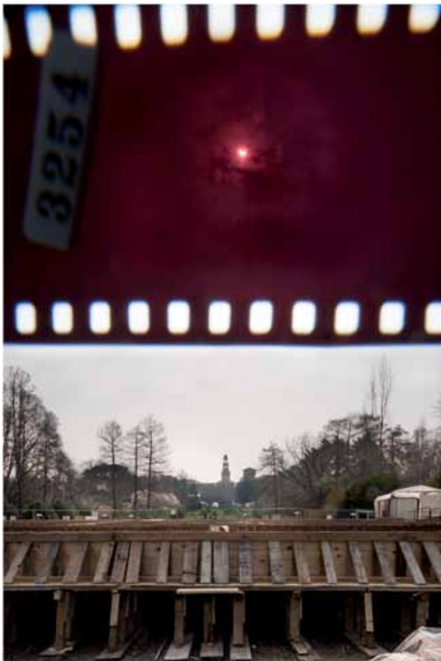
Eclisse 3254, Teatro Continuo di Burri, Parco Sempione, Milano, 2015, fine art ink jet print su carta baritata, cornice legno bianca, 150 x 100 cm