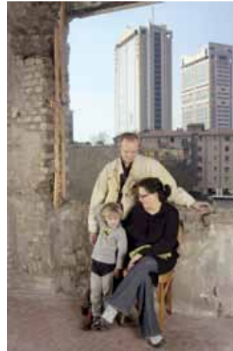
Framing the Community Milano, 2006, serie di 55 fotografie, 70 x 100 cm