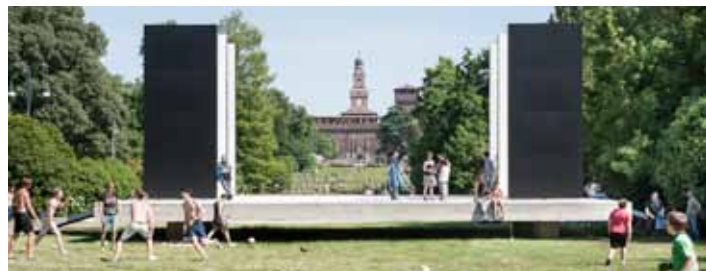
Teatro Continuo di Burri, Parco Sempione, Milano, 2015, serie di fotografie a colori, fine art ink jet print su carta baritata, 100 x 250 cm