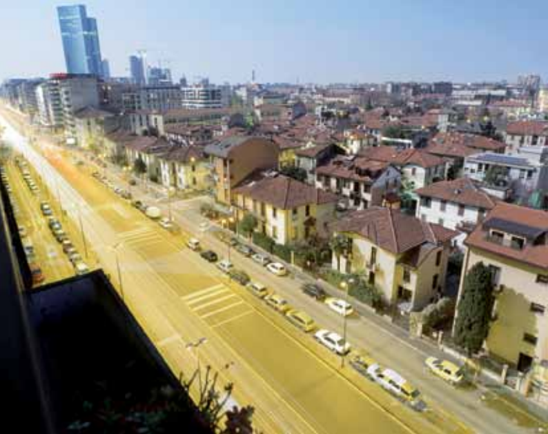
Rear Window, Milano casa Margherita, 2012, fotografia, 40 x 55 cm