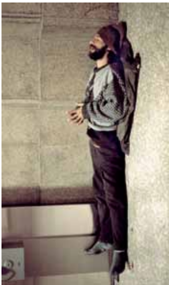
Rischiamo pene molto severe , 1998-2001, fotografia, 210 x 125 cm