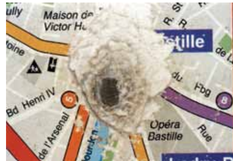
La disparition , 1994/95, collage di 350 fotografie, 400 x 450 cm