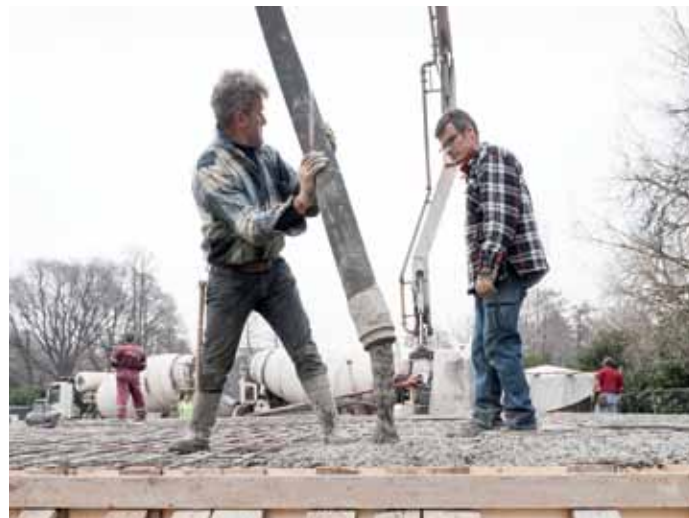
Teatro Continuo di Burri, Parco Sempione, Milano, 2015, serie di fotografie a colori, fine art ink jet print su carta baritata, 30 x 40 cm