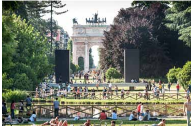
Teatro Continuo di Burri, Parco Sempione, Milano, 2015, serie di fotografie a colori, fine art ink jet print su carta baritata, 100 x 150 cm